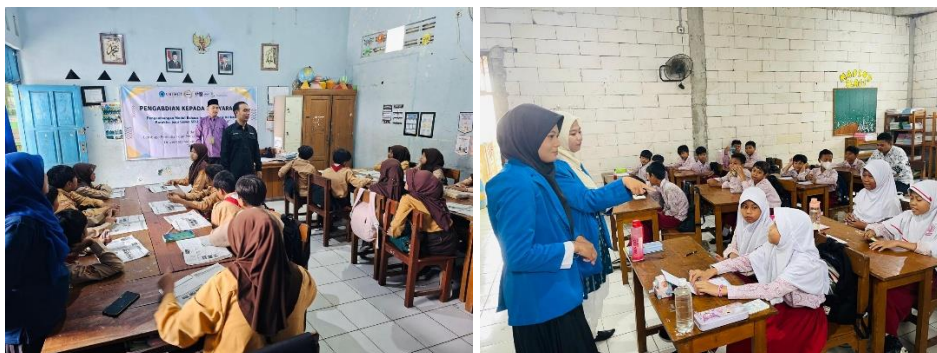
Gambar 3. Dokumentasi uji coba modul di kelas VI A dan VI B)

mengamati bahwa siswa menjadi lebih reflektif dan mampu menilai kembali tindakan mereka setelah mengikuti kegiatan pembelajaran. Secara keseluruhan, guru menilai modul ini tidak hanya meningkatkan kemampuan bahasa Inggris siswa, tetapi juga memperkuat aspek pembinaan karakter yang sesuai dengan visi sekolah.