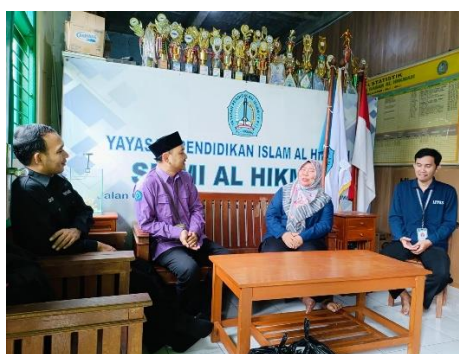
Gambar 1. Dokumentasi wawancara guru dan kepala sekolah

Untuk melengkapi analisis kebutuhan, wawancara singkat dilakukan kepada kelompok siswa. Mayoritas siswa menunjukkan minat yang besar terhadap pembelajaran berbasis cerita (story-based learning), permainan (games), dialog sederhana, dan kegiatan berwarna yang dekat dengan kehidupan mereka seperti tema “My School Life”, “Healthy Food”, dan “My Community”. Preferensi siswa ini menunjukkan perlunya modul tematik yang menyajikan gambar, aktivitas kreatif, dan latihan refleksi yang ramah anak.